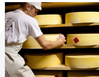
Coopérative Ici en Chartreuse