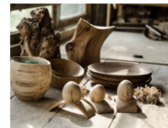
Peter Pan Bois