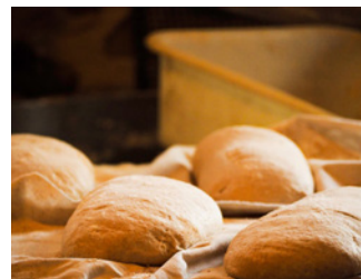
Les Champs du pain

ou sur la carte de la Route des Savoir-Faire et des Sites Culturels (disponible gratuitement dans les Offices de Tourisme du massif).